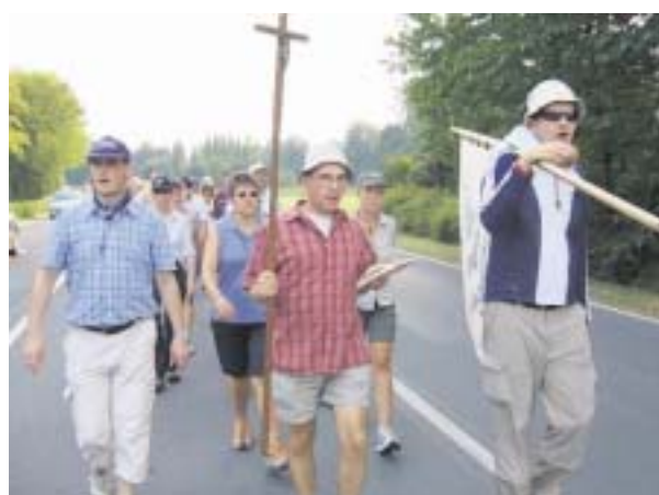
Weit ist der Weg nach Kevelaer.

KEVELAER-PILGER. Am 15. September geht es zum 65. Mal von Dinslaken aus zur „Trösterin der Betrübten“ in die Marienstadt.